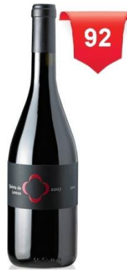
Quinta de Lemos Jaen 2007