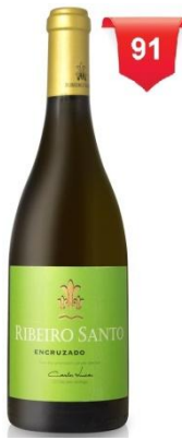
Ribeiro Santo Encruzado 2015