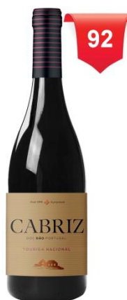
Quinta de Cabriz Touriga Nacional 2010